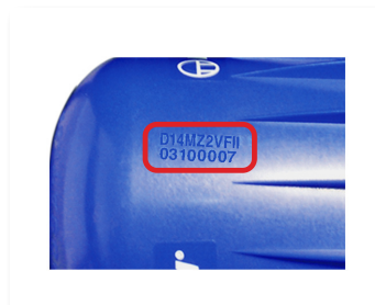
D14 & D8/D40